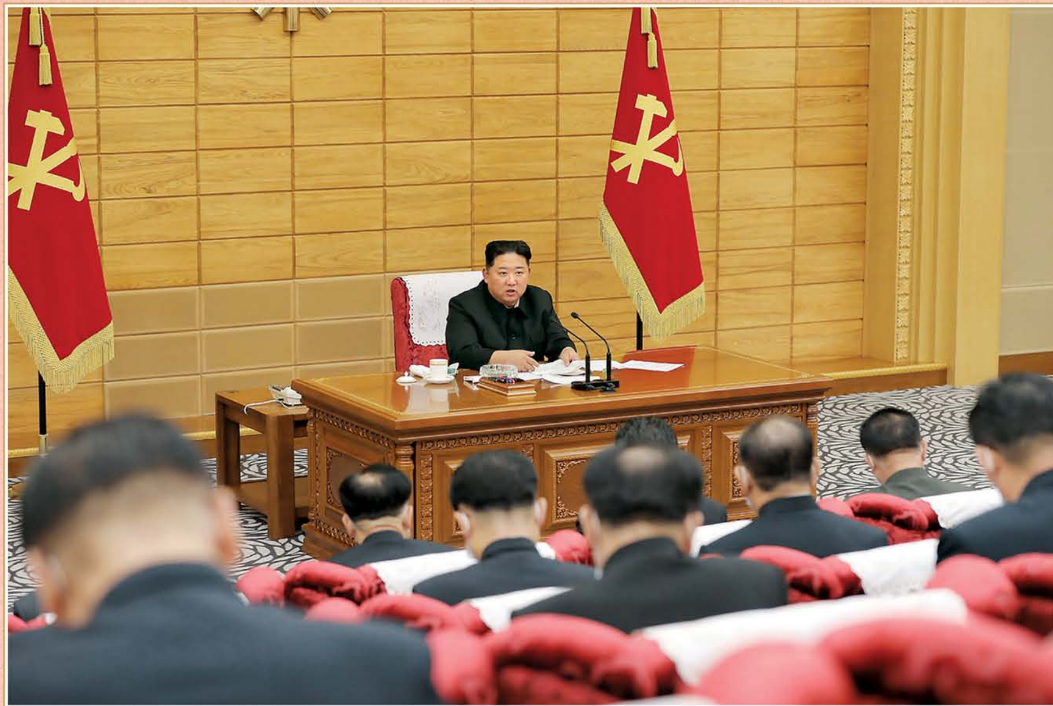
朝鲜劳动党中央委员会政治局协议会举行 2022年5月14日

敬爱的金正恩同志在朝鲜劳动党中央委员会政治局协议会上说，越有困难，我们社会互帮互带、情同手足的情意越会成为比任何最新医科技术更具威力的防疫大胜的秘诀、保证，所有党组织要周密安排组织政治工作，在这一艰苦的防疫大战中更加高度发扬世上谁也无法拥有也不能模仿的我国最好的共产主义美德之风。