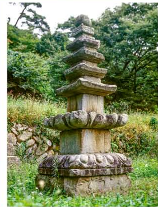
九月山保存着显示朝鲜人民悠久历史和文化的月精寺、浮屠群等许多遗址遗物。