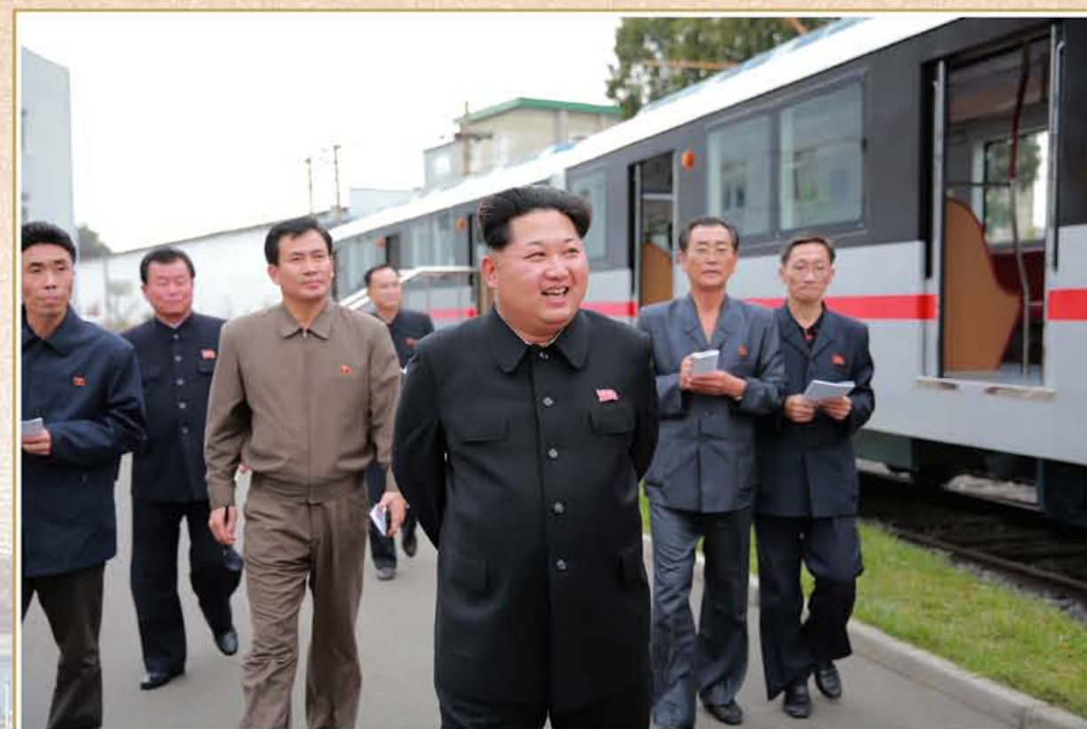
敬爱的金正恩同志察看金钟泰电力机车联合企业新制造的地铁电动列车。2015年10月