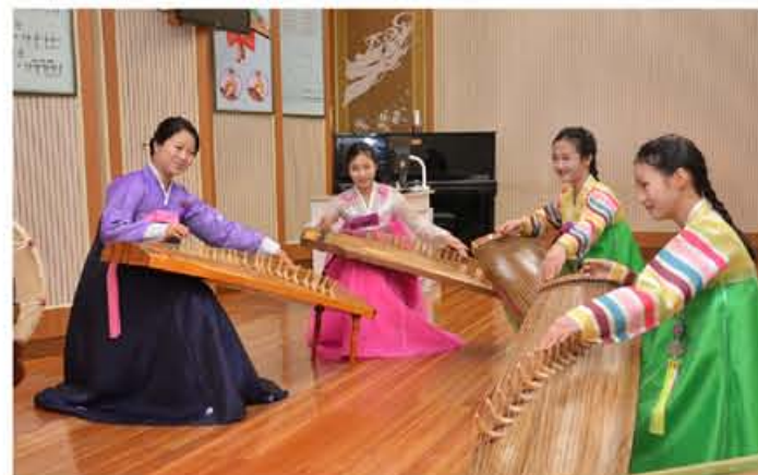
万景台学生少年宫的艺术小组员们在辅导教师的积极辅导下学习艺术技巧。