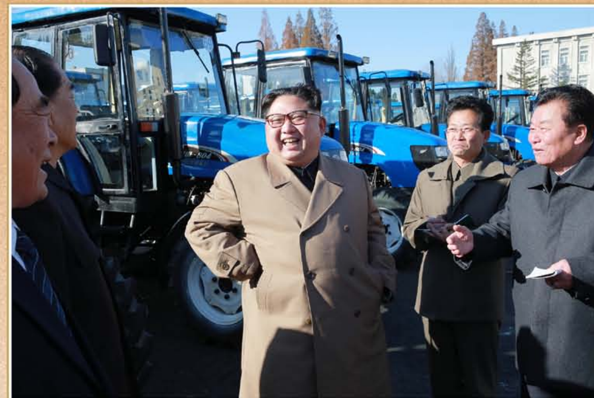
敬爱的金正恩同志视察金星拖拉机厂。2017年11月