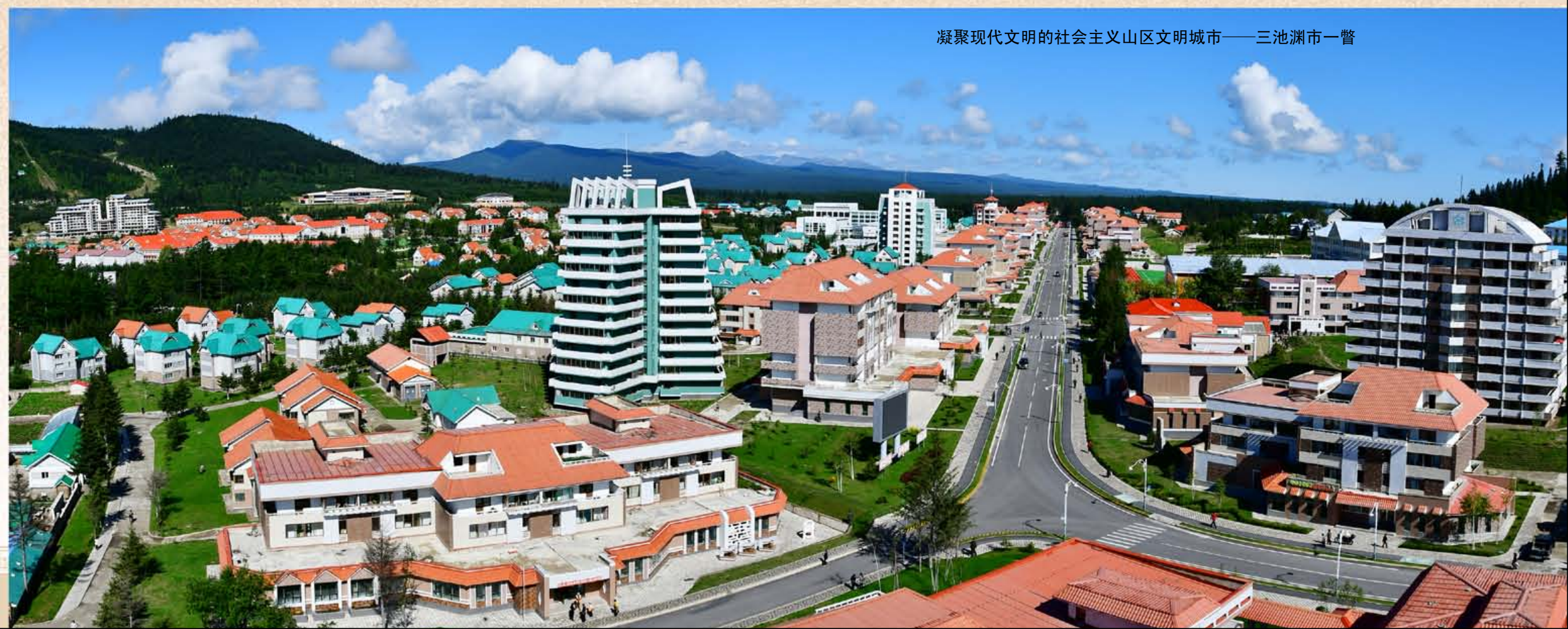
凝聚现代文明的社会主义山区文明城市——三池渊市一瞥