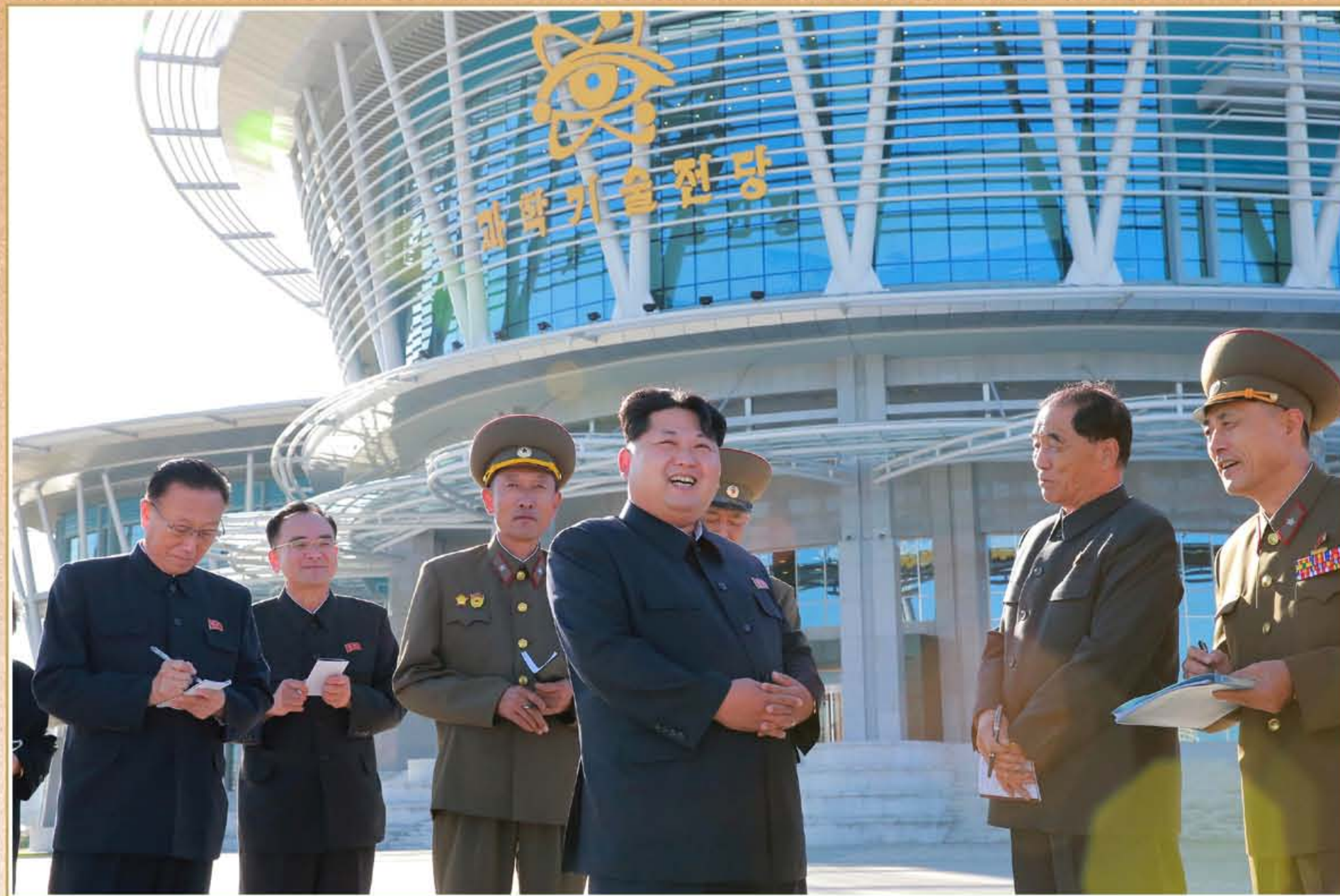
敬爱的金正恩同志视察科学技术殿堂。2015年10月

敬爱的金正恩同志阐明社会主义强国建设中科学技术所占的地位、重要性和飞跃发展科技的任务和途径，并英明领导依靠科技威力打开实现繁荣的康庄大道。