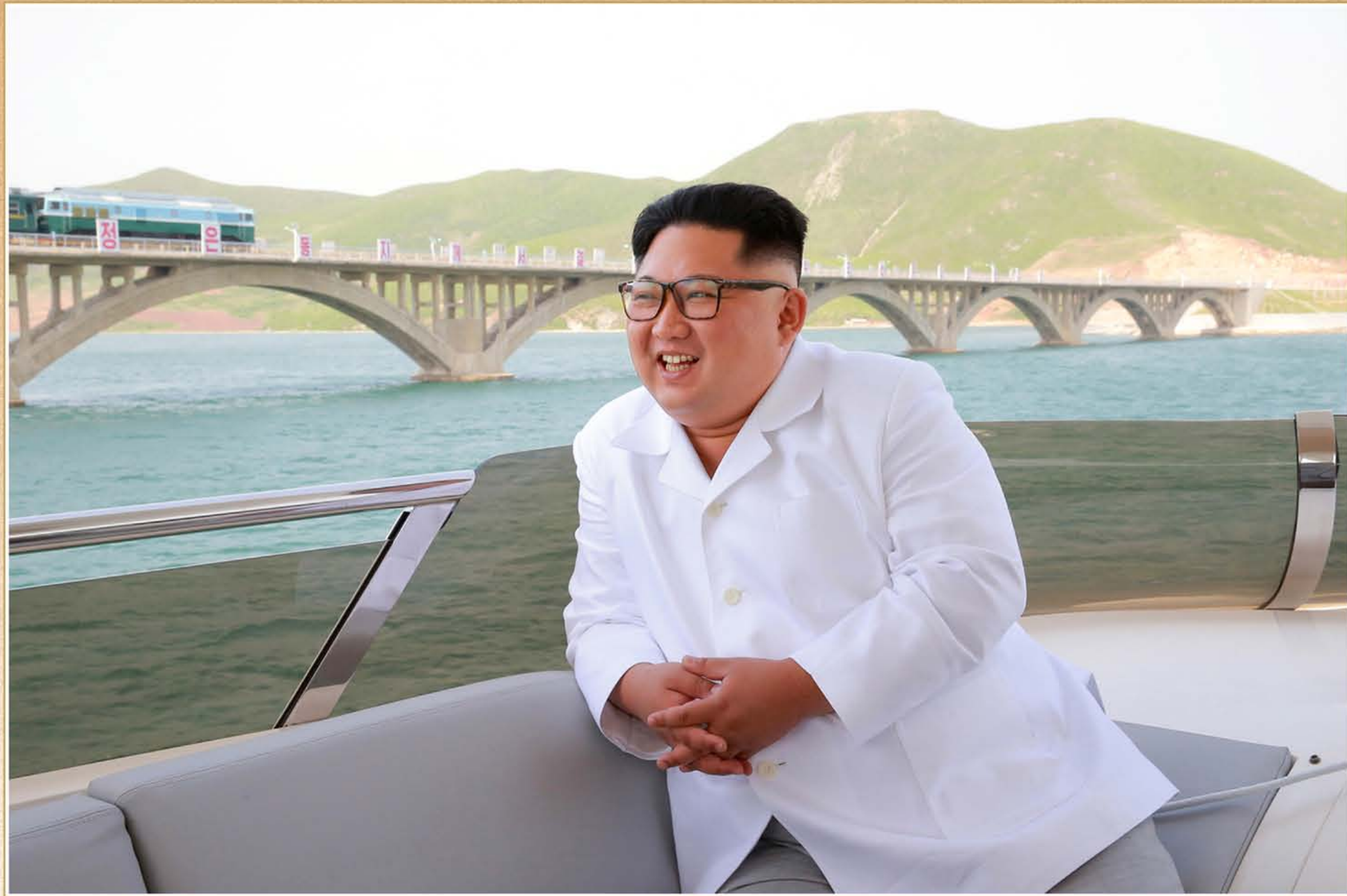
敬爱的金正恩同志为了我国的繁荣昌盛不断进行视察指导。2018年5月

敬爱的金正恩同志以卓绝的思想、非凡的领导、宏伟的革命实践谱写不朽的历史。在他的英明领导下，朝鲜人民冲破如果换成别人就会跌倒在地、畏缩不前的艰难险阻，不断带来世人惊叹的事变，这片土地上展现出繁荣富强的人民乐园。