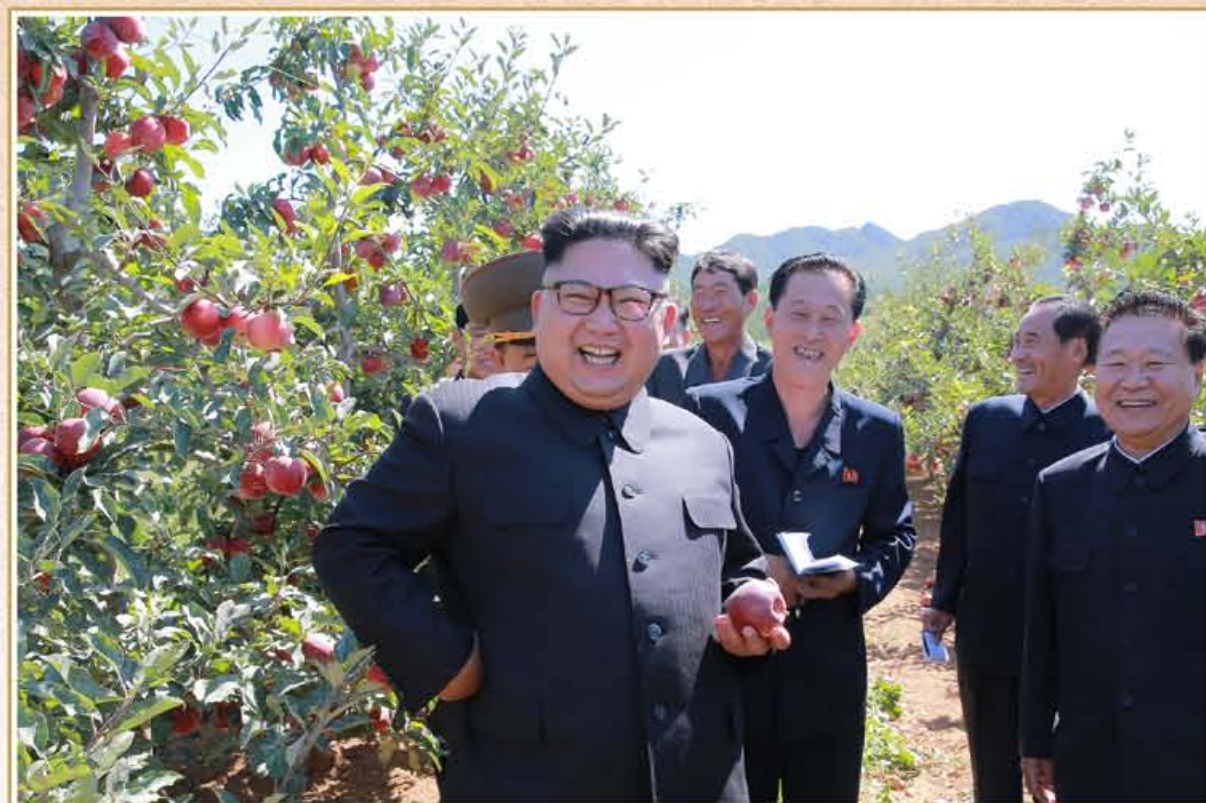
敬爱的金正恩同志视察黄海南道水果郡。2017年9月