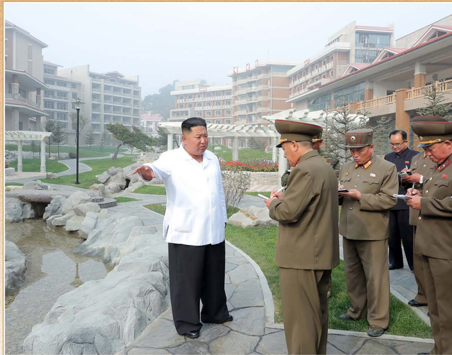
敬爱的金正恩同志视察即将完工的阳德温泉文化休养地建设工地。2019年10月

会上强调，今天，我们可以依靠的只有自己的力量，只有具有自力自强的精神，才能克服任何困难和考验，在最为恶劣的环境中也能取得最大成就。