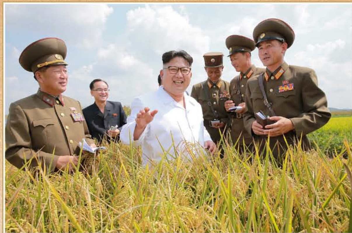
敬爱的金正恩同志视察1116号农场。2016年9月