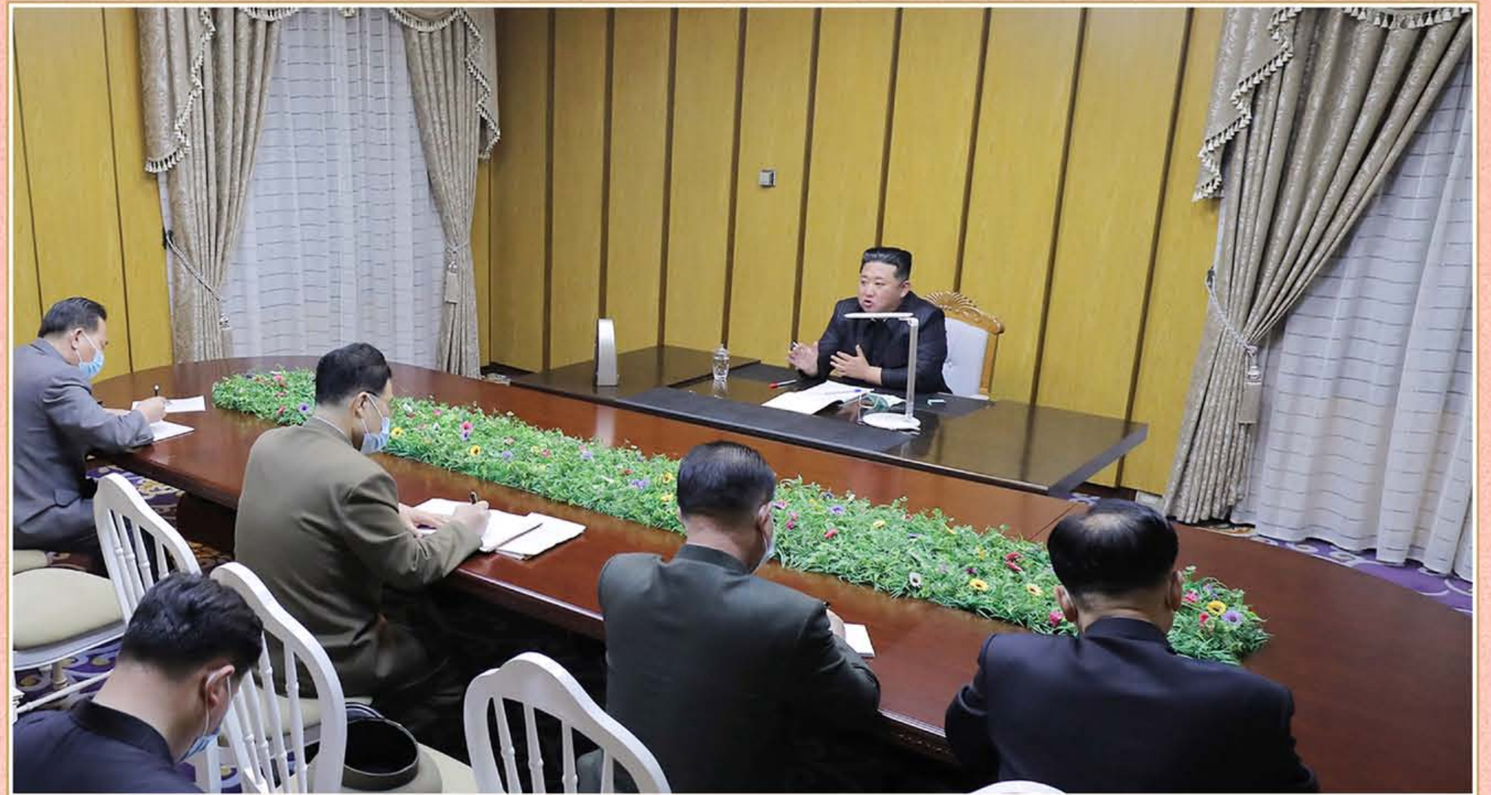
敬爱的金正恩同志访问国家紧急防疫司令部 2022年5月12日

敬爱的金正恩同志访问国家紧急防疫司令部检查国家防疫工作进入最高级紧急防疫体系后的一天疫情防控情况，并强调，要尽快彻底落实党中央委员会政治局有关主动掌控防疫战胜势的决议事项来迅速遏制疫情扩散事态。