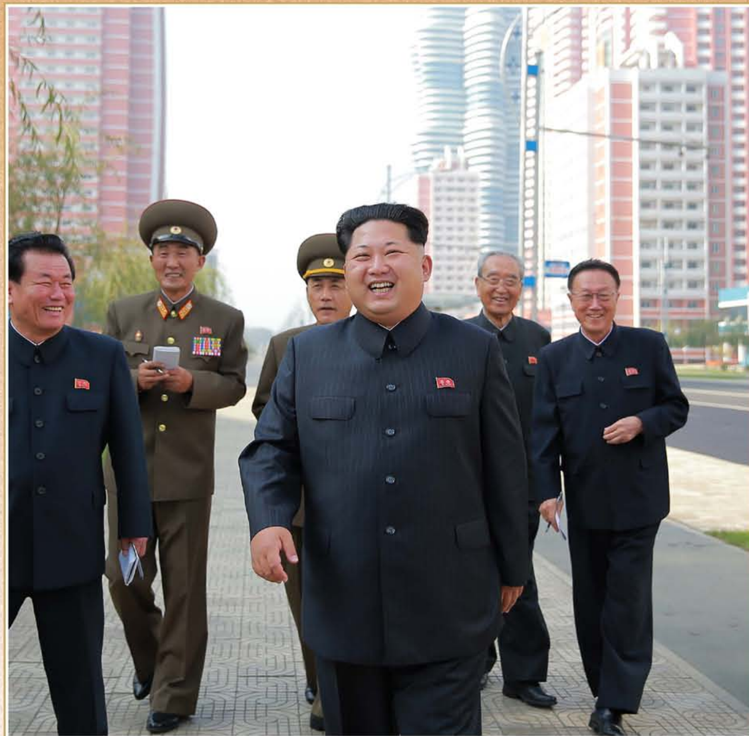
敬爱的金正恩同志视察未来科学家大街。2015年10月

他坚定不移的信念和积极的领导成为冲破面临的考验和难关，指明朝鲜革命前进道路的斗争旗帜，在那么艰苦的条件和环境下，这片土地上得以展现出人民的理想日益得到实现的自力繁荣时代。