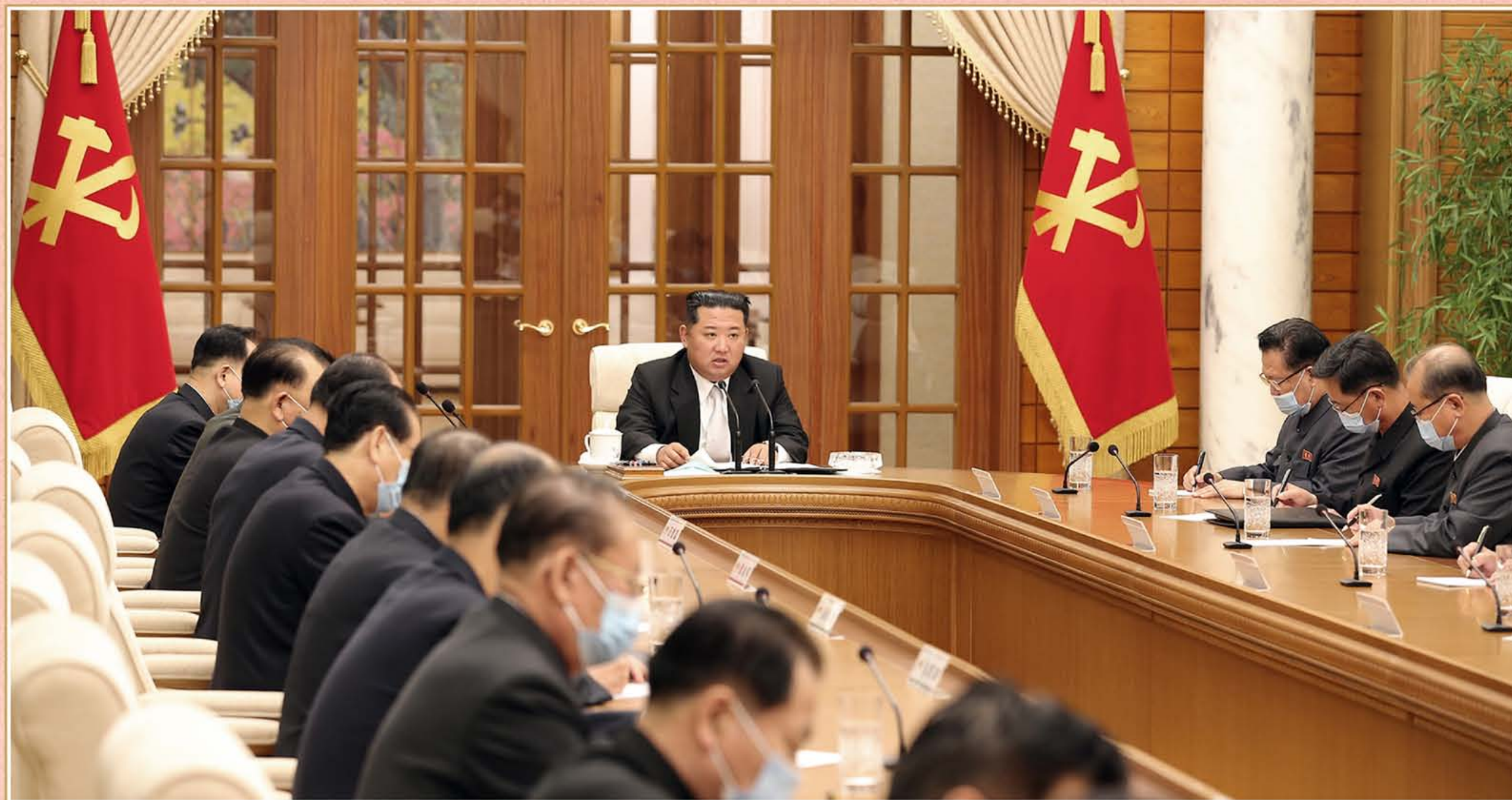
朝鲜劳动党第八届中央委员会 第八次政治局会议举行 2022年5月12日

敬爱的金正恩同志出席朝鲜劳动党第八届中央委员会第八次政治局会议，通过了关于针对目前的防疫危机，将国家防疫工作转移到最高级紧急防疫体系的决议。