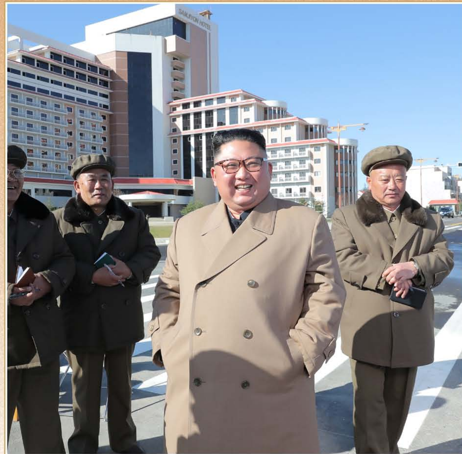
敬爱的金正恩同志视察三池渊郡内的建设工地。2019年10月

他把社会主义朝鲜转变为任何侵略势力也不敢轻视的自卫强国，缔造了子孙万代的幸福和民族繁荣的可靠保证。